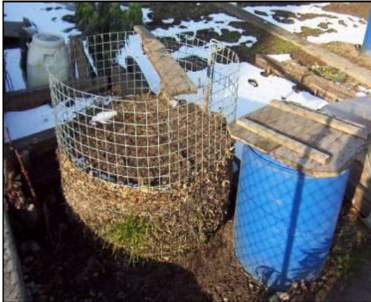
Compostaggio domestico con rete.

Società per la Regolamentazione del servizio di gestione Rifiuti