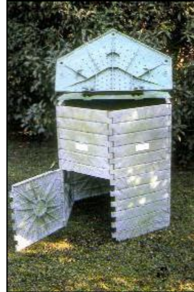
Composter in plastica.

Sarà importante liberalizzare la pratica del compostaggio domestico andando a promuovere l'uso di concimaie e di compostiere realizzate in modo artigianale (reti, strutture in legno, ecc.) senza vincolare la pratica all'acquisto o all'utilizzo di una compostiera.